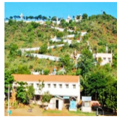
Achirappak Malai Matha Temple